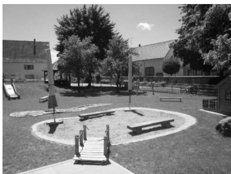
Architekt Patrick Dorn

Probleme im Andachtsraum, nähere Infos unter 07572 / 7632147