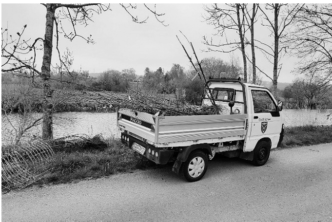
Bauhoffahrzeug der Stadt Scheer mit Equipment und Pflanzen beladen

Am Samstag, den 23.04.2022 wurden im Bereich „Olber“ die Pflanzungen vorgenommen. So wurden Weiden, Pappeln, Stileichen und andere heimische Gewächse und Büsche an der Donau gepflanzt. Wegen des Bibers mussten die Pflanzungen zudem mit Drahtosen versehen werden. Die Pflanzungen werden in der Zukunft zur Beschattung des Gewässers und somit zu einer reduzierten Wassertemperatur beitragen und zudem als Unterschlupf für Fische und andere Tiere dienen. Vielen Dank an dieser Stelle den ehrenamtlichen Helfern, die die Pflanzungen vorgenommen haben, der Stadt Scheer für die Bereitstellung des Fahrzeuges und der Gewässerdirektion Riedlingen für die Bereitstellung und Anlieferung der Pflanzen.