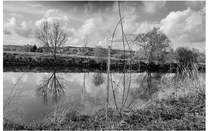
Gesetzte Uferbepflanzung mit Drahtose als Verbißschutz