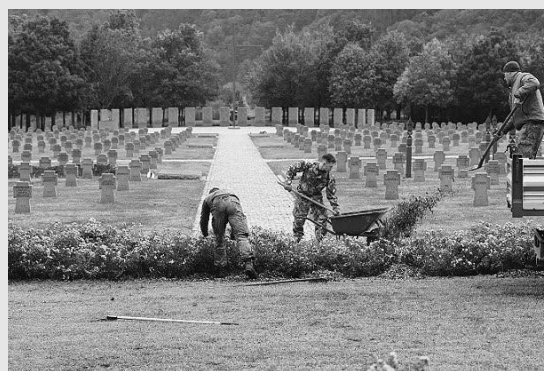
85 deutsche Soldaten wurden bei einer Gedenkveranstaltung auf der Kriegsgräberstätte in Budaörs (Ungarn) beigesetzt. Im Vorfeld führten Deutsche und ungarische Soldaten einen gemeinsamen Arbeitseinsatz durch. Bisher haben hier 16.600 Kriegstote ihre Ruhstätte gefunden.