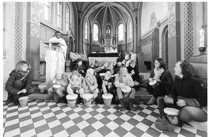
Die Kinder vom KIGO-Team