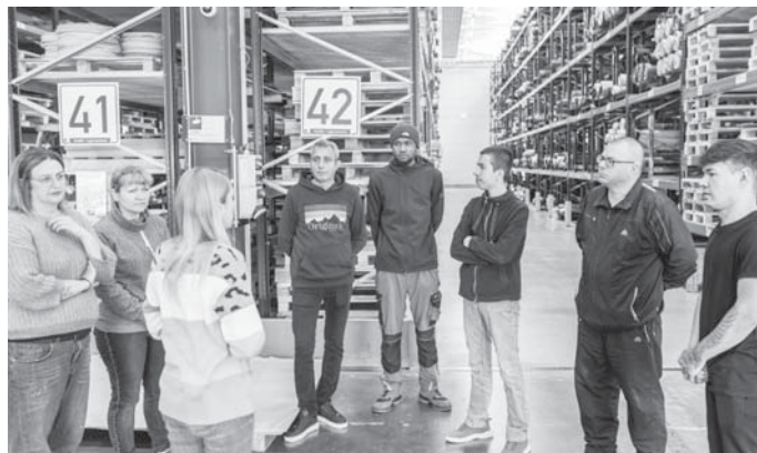
Zum Auftakt der Projektreihe „Tage der Vielfalt“ informieren sich Geflüchtete in Scheer über die Karl Späh GmbH & Co. KG.