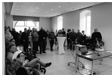
Gespannt verfolgen die geladenen Gäste die Präsentation des Rundwegs im Rathaus.

Im Beisein von Frau Gerlinde Kretschmann und weiterer geladener Gäste fand am vergangenen Samstag die offizielle Eröffnung des Eduard Mörrike&Josephine-Rundwegs in Scheer statt. Das Projekt wurde zu 80% von LEADER gefördert.