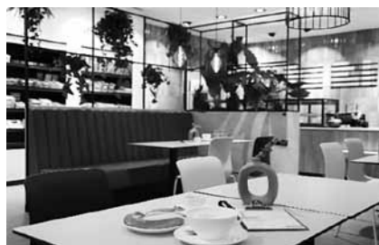
So sieht das neue Café Auszeit im Innenraum aus.

Seit dem 7. Februar 2025 hat das Café Auszeit regulär geöffnet. An sieben Tagen die Woche lassen sich dort frische Kaffeespezialitäten und weitere Getränkeangebote, verschiedene Backwaren sowie kleinere warme Gerichte mit festen Klassikern und wechselndem Angebot genießen. Bei Kuchen, Gebäck und Snacks findet sich auch etwas für den süßen Hunger. Verwendet werden vor allem regionale Lebensmittel. Ergänzt wird das Angebot durch ein buntes Kiosksortiment für die Patient:innen und Angehörige, wie Hygieneartikel sowie Zeitschriften und Maga-