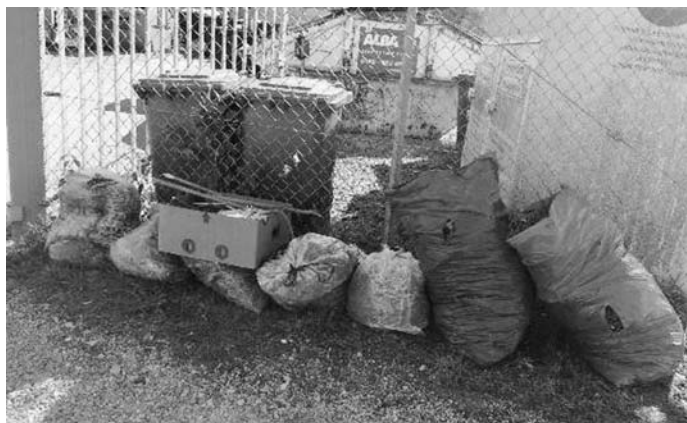
Grünmüll, Holz und Sonstiges: nachts am Recyclinghof in Scheer „angeliefert“

Hier nochmals die Öffnungszeiten des Recyclinghofs: