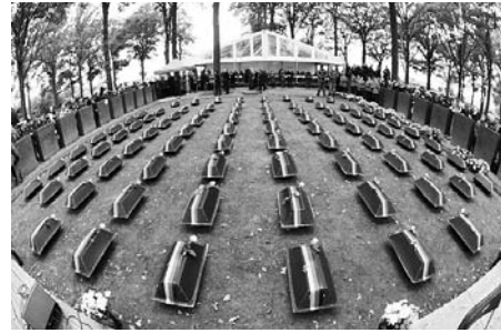
Einbettung von 84 deutschen Soldaten in Langemark/Belgien. Die Toten wurden bei archäologischen Arbeiten an der früheren Stellung "Hill 80" bei Wijtschate (Heuvelland) gefunden.

In wenigen Wochen jährt sich der Gründungstag des Volksbundes, der 16. Dezember 1919, zum 100. Mal. Ein Jahr war nach dem Ende des Ersten Weltkrieges vergangen. Es gab so viel zu tun!