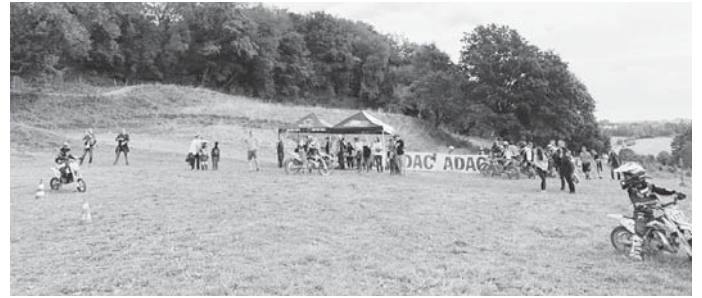
Euer Jugend-Team des RRT-Scheer