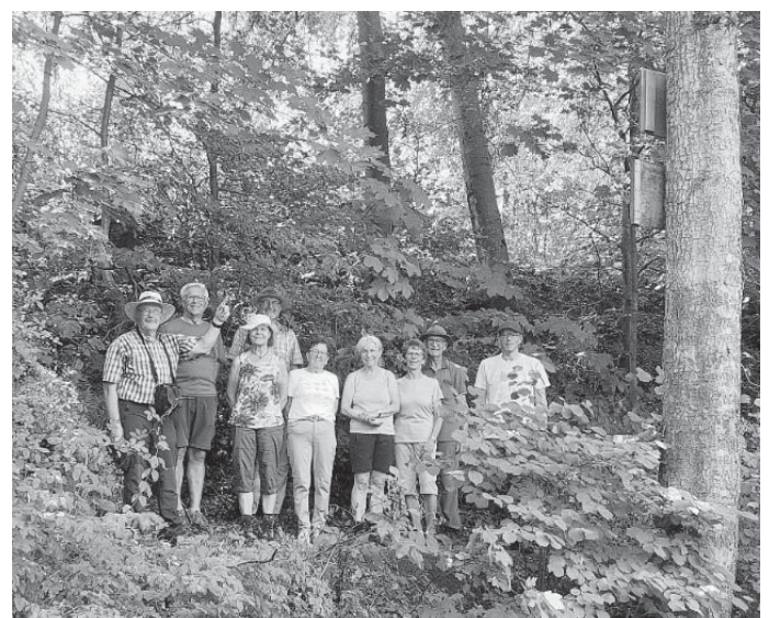
Die Gruppe bei der Grenzsteinwanderung des Schwäbischen Albvereines OG Scheer.